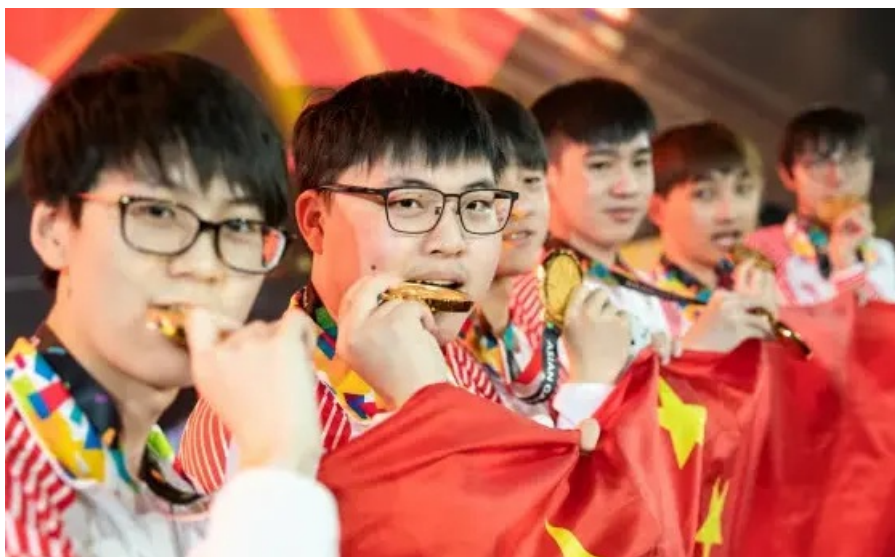
Uzi夺得2018年雅加达亚运会《英雄联盟》表演赛冠军

今年3月，央视播出了《电子竞技在中国》纪录片，伴随着产业快速发展，政策上的重视也凸显出来，上海市要在3-5年内建成“全球电竞之都”，全方面支持电竞产业在上海的落地发展，北京则发布“电竞北京2020计划”，加快支持电竞产业发展。