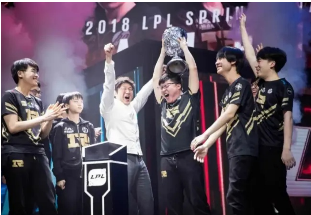
2018年LPL春季赛RNG夺冠，Uzi的第一个冠军

“特别是2018年的时候，你让我现在回想起那一年，我都不觉得我自己真正的是一个那么好的自己，我没有想过那一年会是我整个职业生涯最好的一年”，Uzi在退役采访中说，他认为S3、S4的时候才是他个人最巅峰的时候，能做出几乎不可能的操作，时间虽然降低了他的敏捷度，但也给了他别的馈赠。