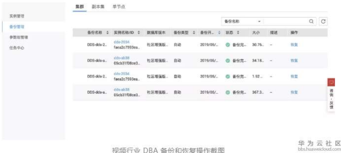
视频行业 DBA 备份和恢复操作截图