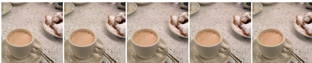
Figure 1. A randomly selected cover image (left) and the corresponding steganographic images generated by STEGANOGAN at approximately 1, 2, 3, and 4 bits per pixel.