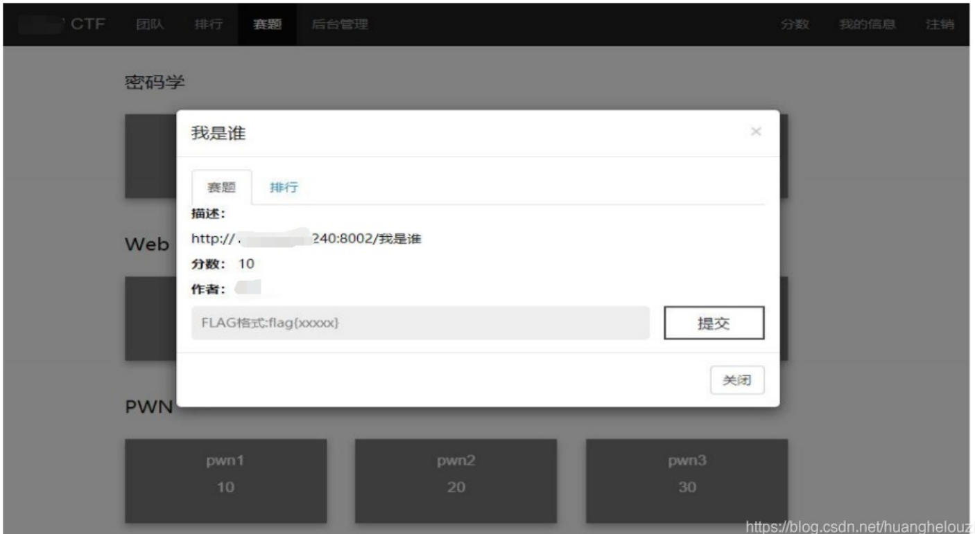
赛题详情以及提交FLAG界面