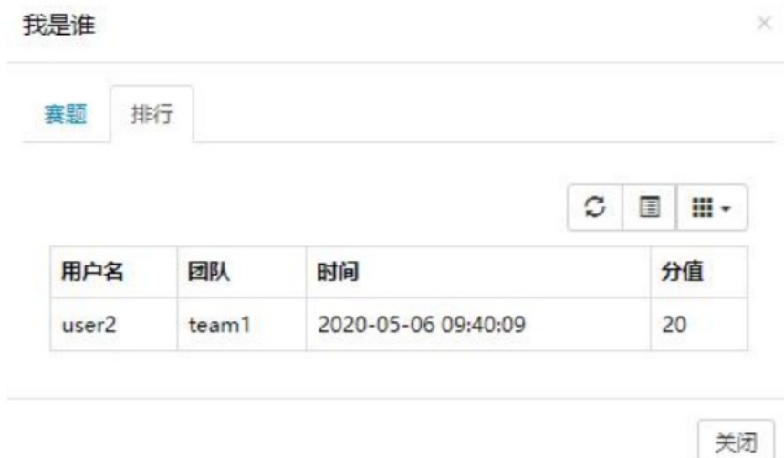
每道题解题情况（排名）