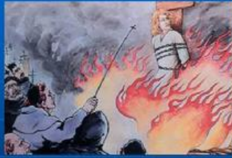
科学的殉道士——乔尔丹诺·布鲁诺 (公元1548~1600年)